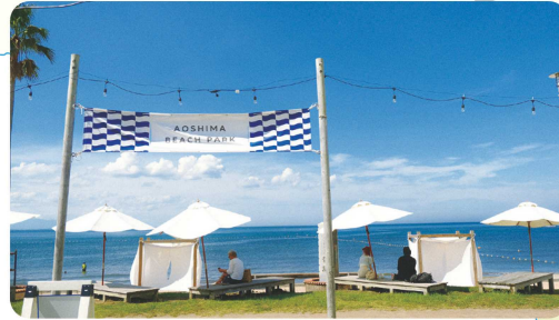
AOSHIMA BEACH PARK

青島ビーチパーク 事務局 ☎ 0985-65-1055 (青島ビーチセンター 渚の交番) 定休日: 水曜日 ※定休日や営業時間は時期や曜日によって変わりますので、ホームページにてご確認ください。 https://www.aoshimabeachpark.com